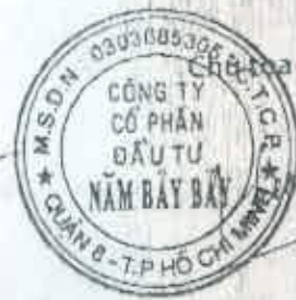
Đoàn Tường Triệu