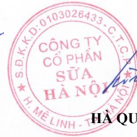
HÀ QUANG TUẤN