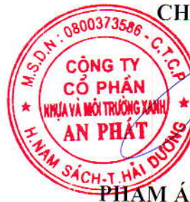
PHẠM ÁNH DƯƠNG